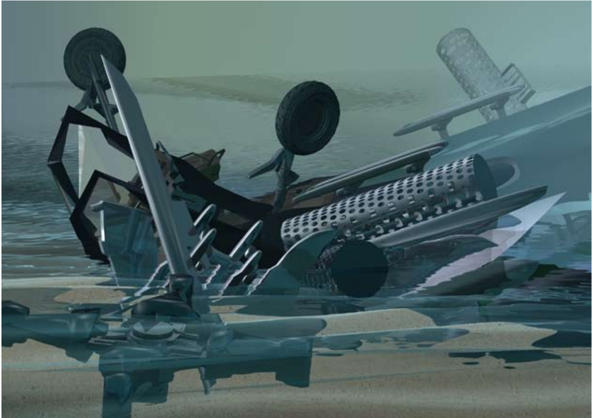
Kopfüber XIII 2008, Pigmentdruck auf Aluminium, 100 x 140 cm / pigment print on aluminium, 39.4 x 55.1 in